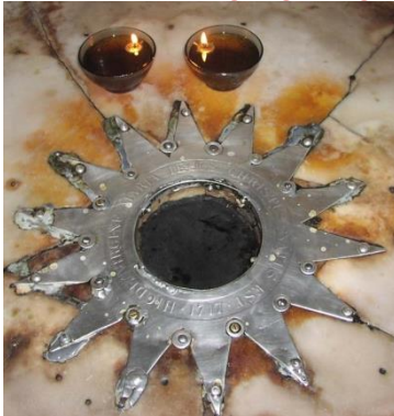
(Friedensstern in der Geburtskirche von Bethlehem)

Zu allen Zeiten haben die Menschen sich nach Frieden untereinander und auch auf der Welt gesehnt. Der echte Frieden kommt nicht von uns Menschen, sondern ist uns in der Geburt von Jesus Christus von Gott geschenkt worden. So sagt Jesus: „Selig die Frieden stiften, sie werden Kinder Gottes genannt werden!“